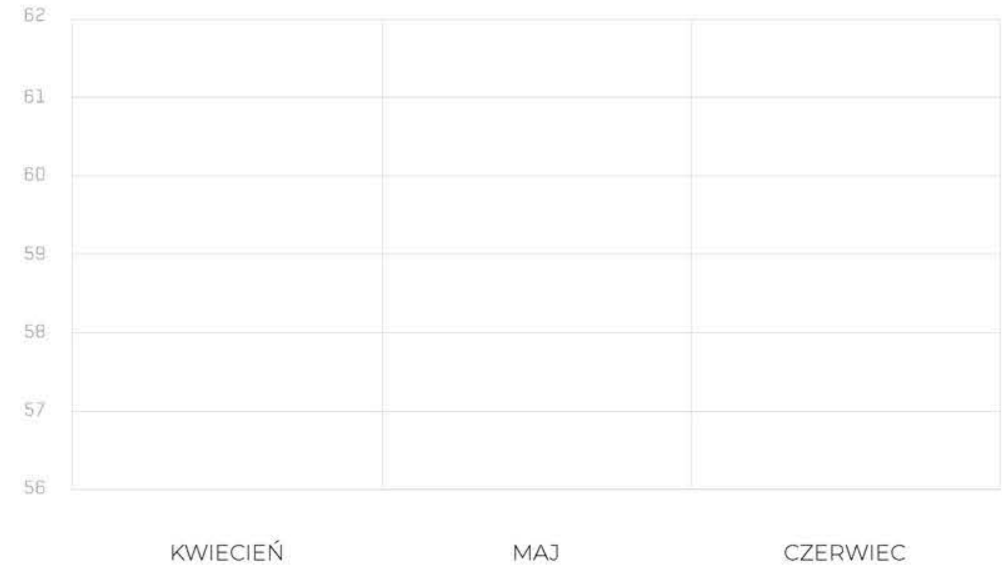
IMPACT Wskaźnik I4 (złoty kwartał do poprzedniego)