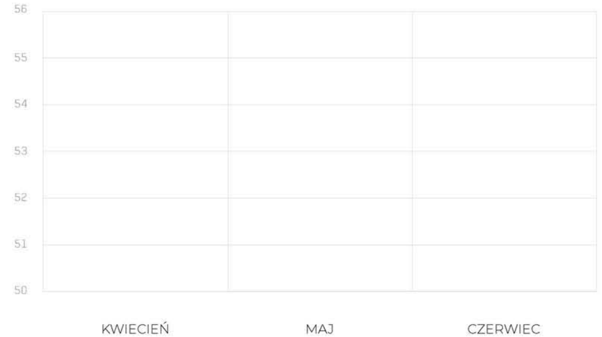
HYPE: Wzrost +4 (od kwietnia do czerwca)